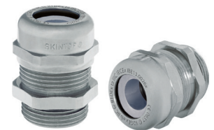
SKINTOP® MSR-M ATEX