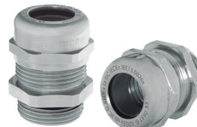
SKINTOP® MS-M ATEX